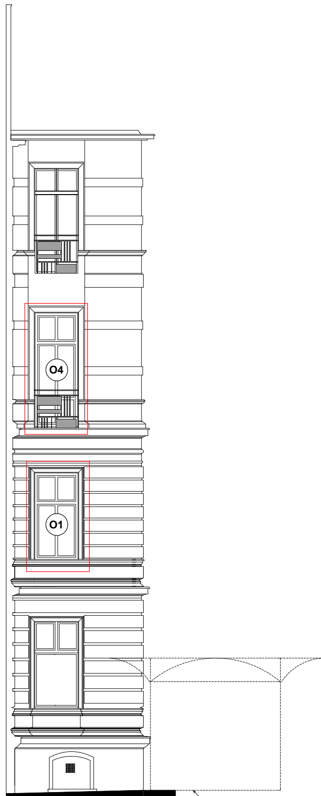
WIDOK - 3