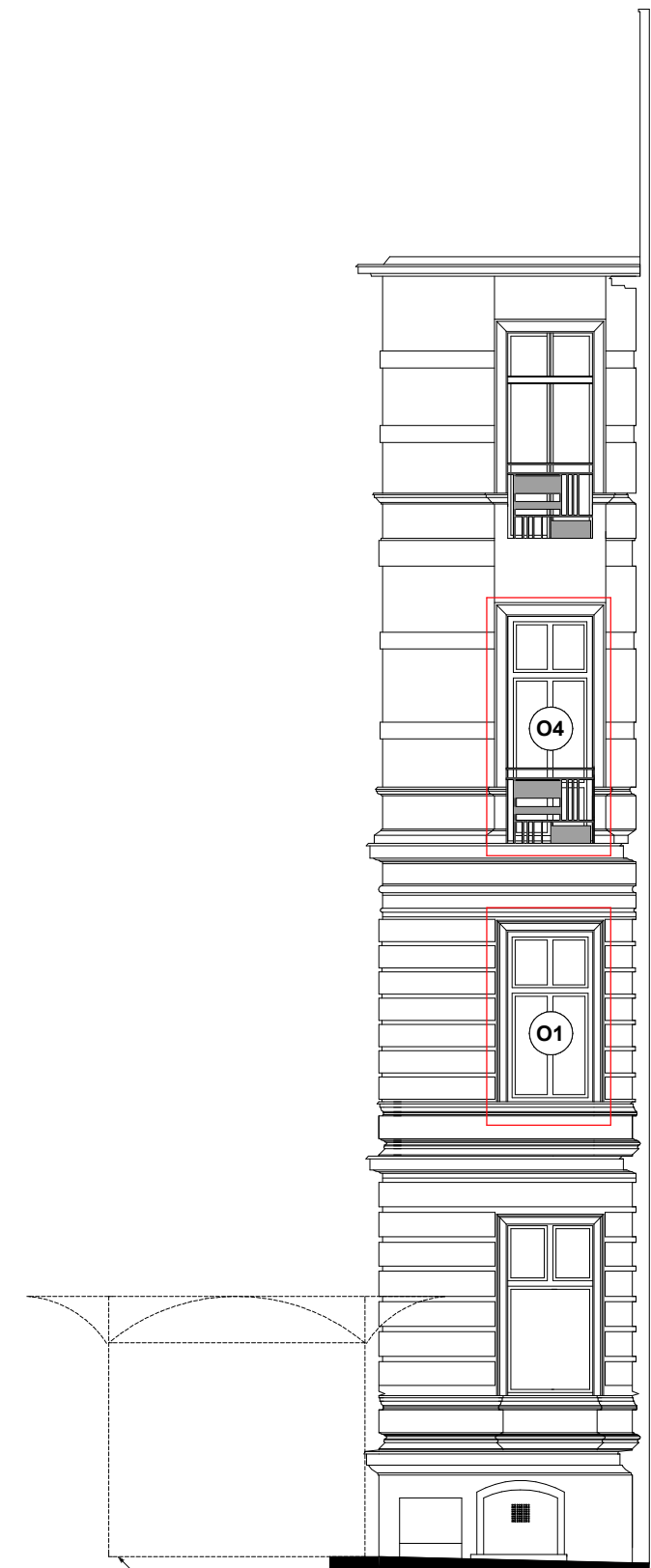
WIDOK - 4