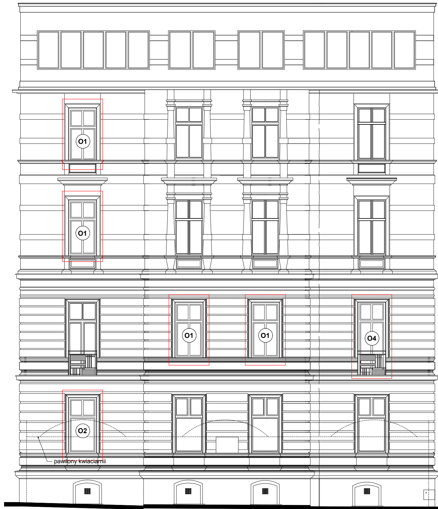
WIDOK - 2