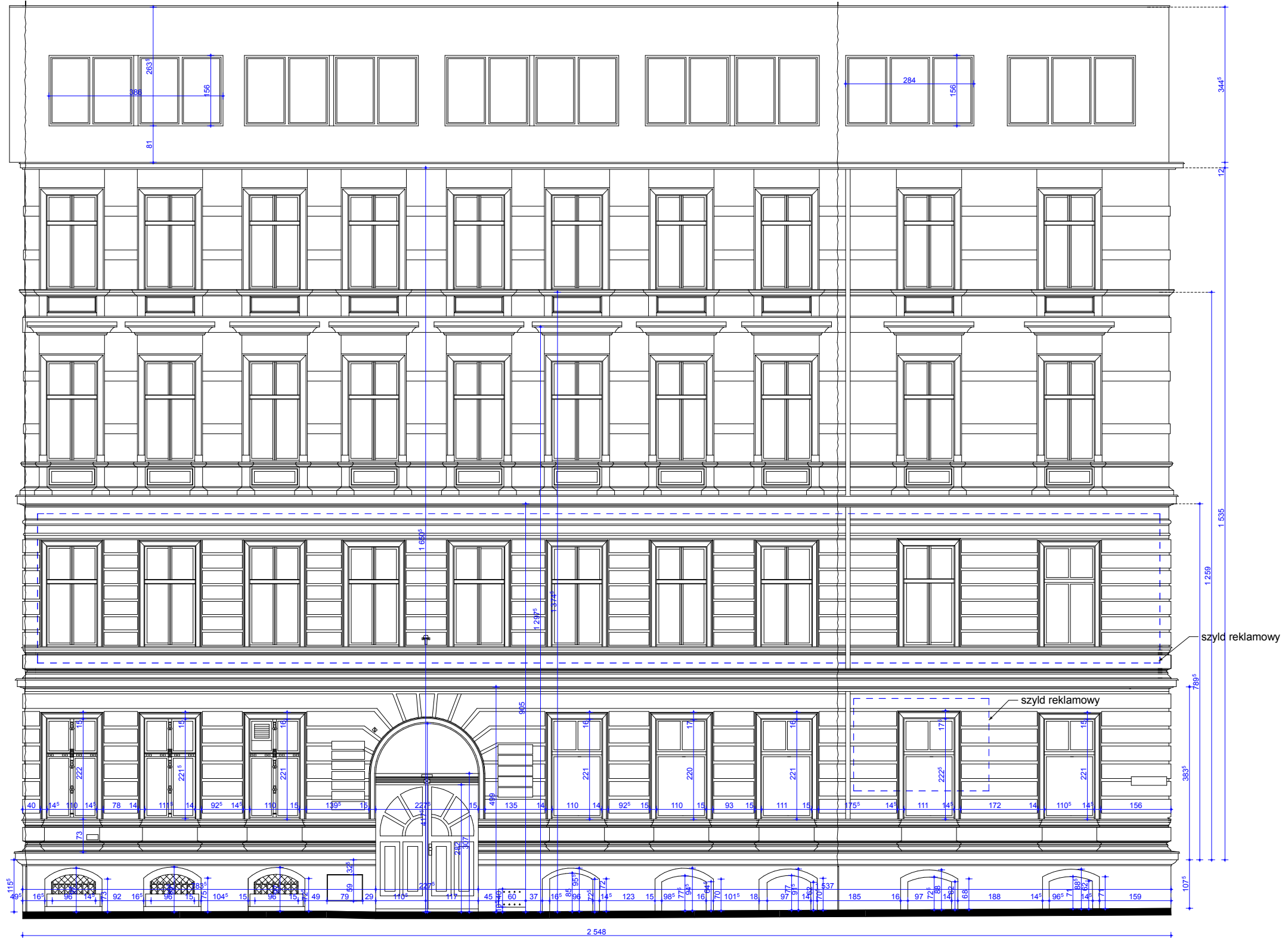
WIDOK - 1