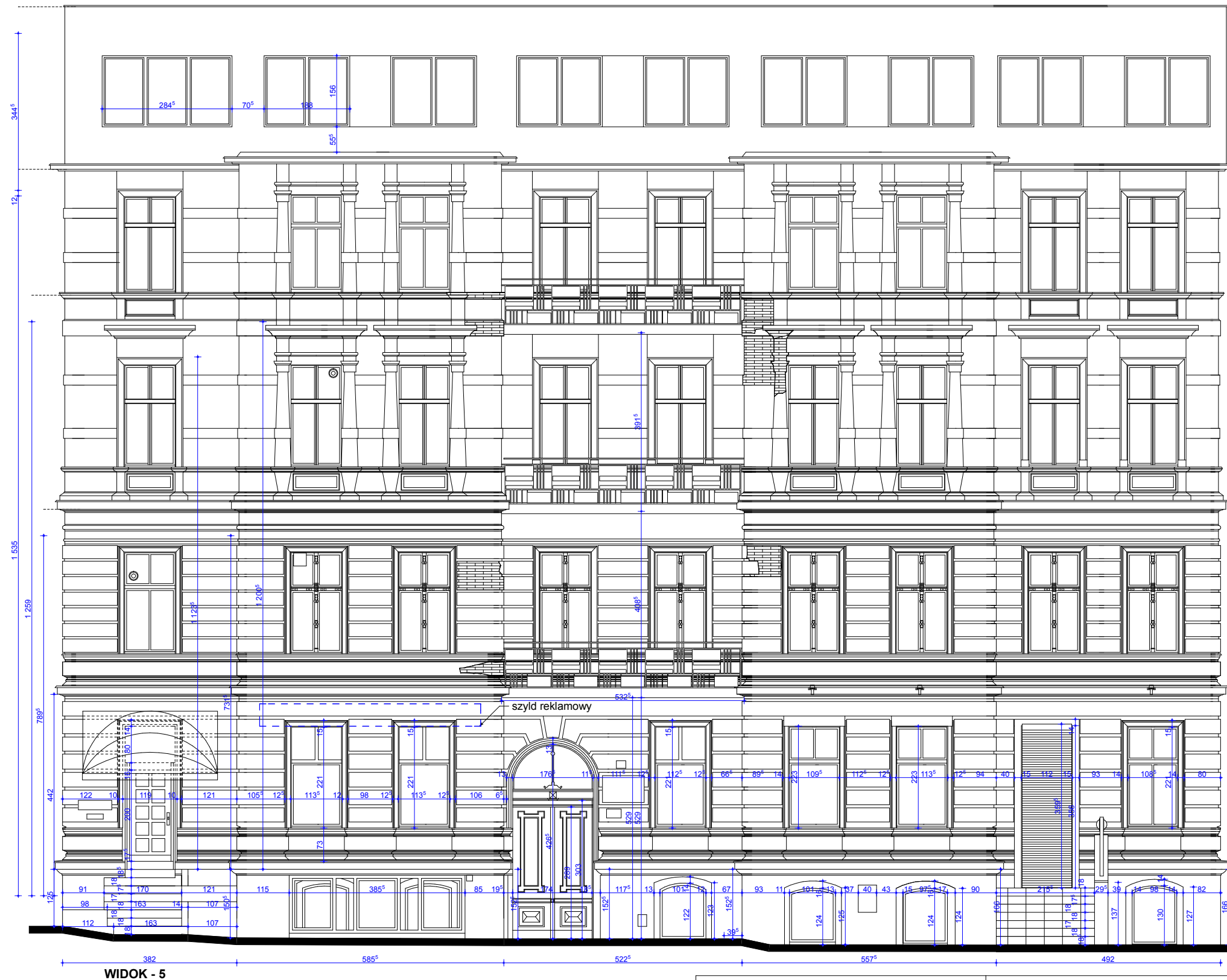
WIDOK - 5